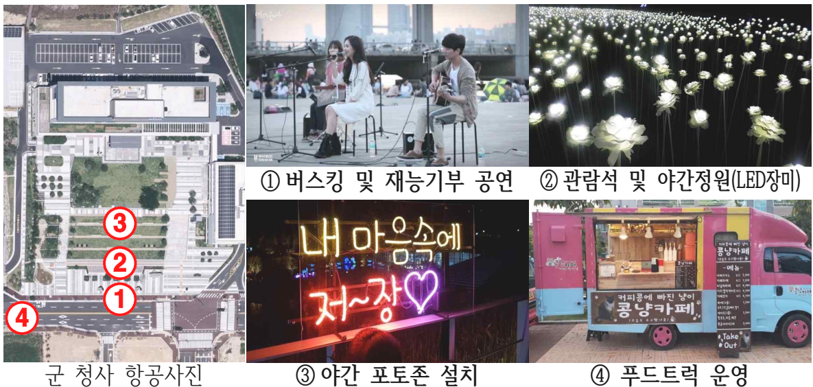
군 청사 항공사진