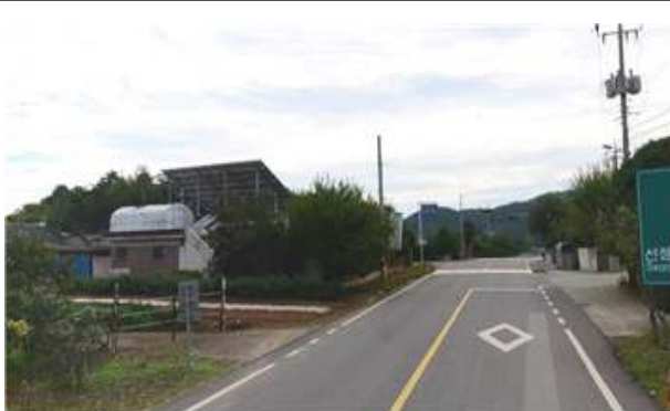
2019 동강중학교~면소재지 보행로 설치공사